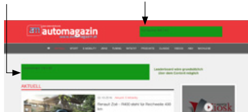
Full Banner/ Rotation