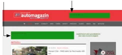
Full Banner/ Rotation