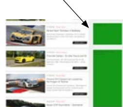
Square Banner/ Rotation