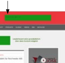
Full Banner/ Rotation