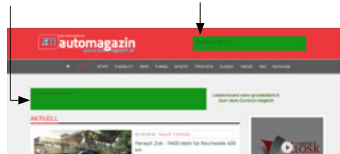
Half Page Banner/ Rotation